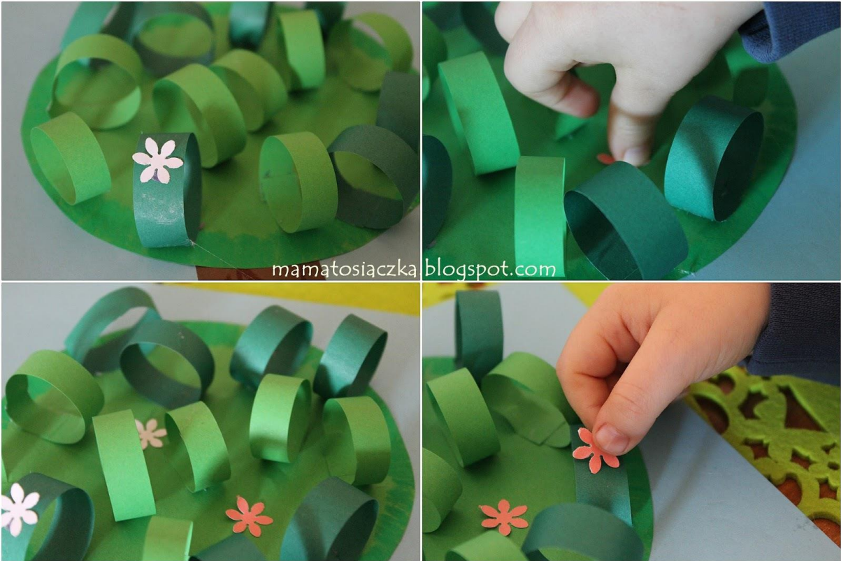
Nasze wiosenne drzewko jest gotowe ☺