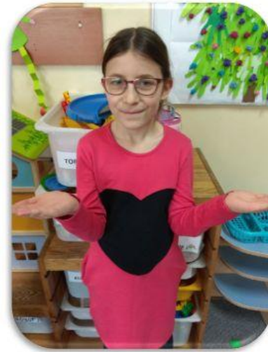
Na zdjęciach zamigane słowo DZIĘKUJĘ.